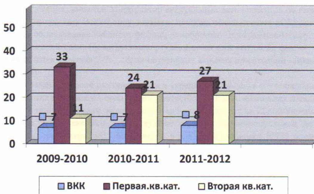
Диаграмма 1. Динамика аттестации педагогов за последние три года

Анализ показывает стабильность состава педагогов образовательного учреждения, текучести кадров нет. Все учителя – предметники, кроме молодых специалистов, аттестованы. При этом в 2010 – 2011 учебном году отмечается снижение количества педагогов первой квалификационной категории. Всего первую и высшую квалификационную категорию имеют 60% учителей, 13 педагогов награждены отраслевыми наградами, 1 педагог в 2008 году стал победителем конкурса ПНПО «Лучшие учителя России».